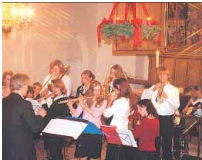
Die Bläserklassen der Kooperativen Gesamtschule Hage begeisterten abermals bei ihrem Weihnachtskonzert in der Ansgari-Kirche Hage. Es spielten fast 100 Schülerinnen und Schüler verschiedener Jahrgänge. Mit dabei auch die Fünftklässler, die erst seit Anfang September ein Instrument erlernen.