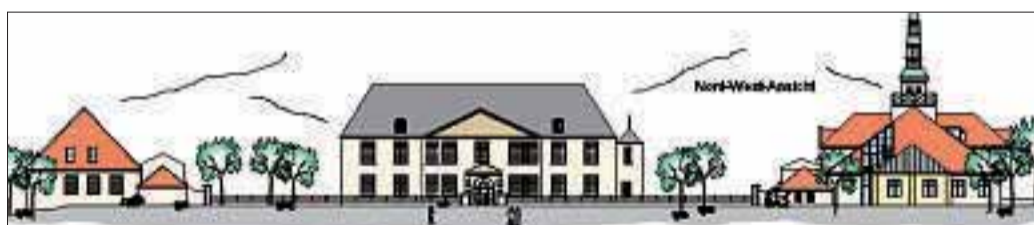
Die Vorburg mit der geplanten Mehrzweckhalle. Der Kontrast von moderner Architektur zum barocken Schlossstil ist bewusst gewählt worden. Links das Rentei-Gebäude, die Mensa entsteht dahinter.

Die Schule verfügt derzeit über zehn Klassenräume, einen Gruppenraum und ver-