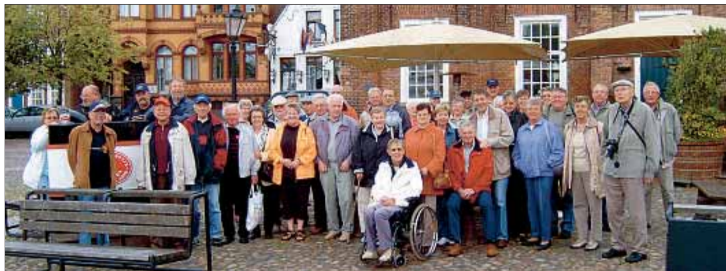
Die AG 60plus unternimmt oft Fahrten in die nähere Umgebung, aber auch Fernziele stehen auf dem Programm. Die Resonanz auf das Reiseangebot ist in den letzten Jahren stetig gestiegen. Unser Bild zeigt eine Berumburer Reisegruppe in Leer.